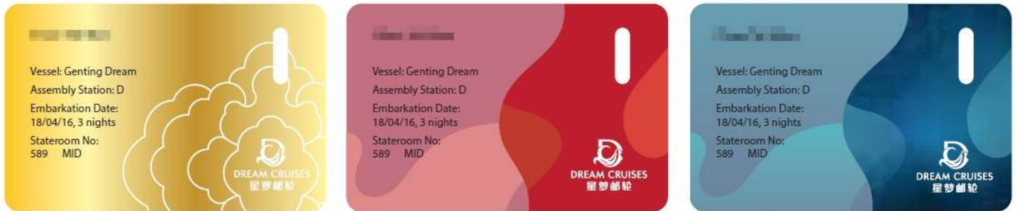
**รูปภาพด้านบนใช้เพื่ออ้างอิงรูปแบบการ์ดเท่านั้น** หากกรณีการ์ดสูญหายกรุณาติดต่อแจ้งทาง Reception

1. เดินทางถึงอาคารผู้โดยสารท่าเรือแรก นำพาสปอร์ต เช็คอินได้ที่ เคาน์เตอร์เช็คอิน ท่านจะได้รับ Cruise Card ที่จะใช้แทนกุญแจห้องพัก ใช้เป็นเครดิตการ์ด แทนการขึ้นและลงเรือในท่าเรือถัดๆไป