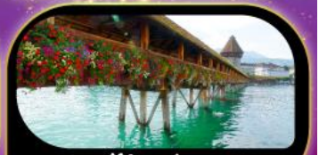
สะพานไม้ฆาปค ลูซิริน