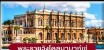
พระราชวังโดลมาบาห์เซ่