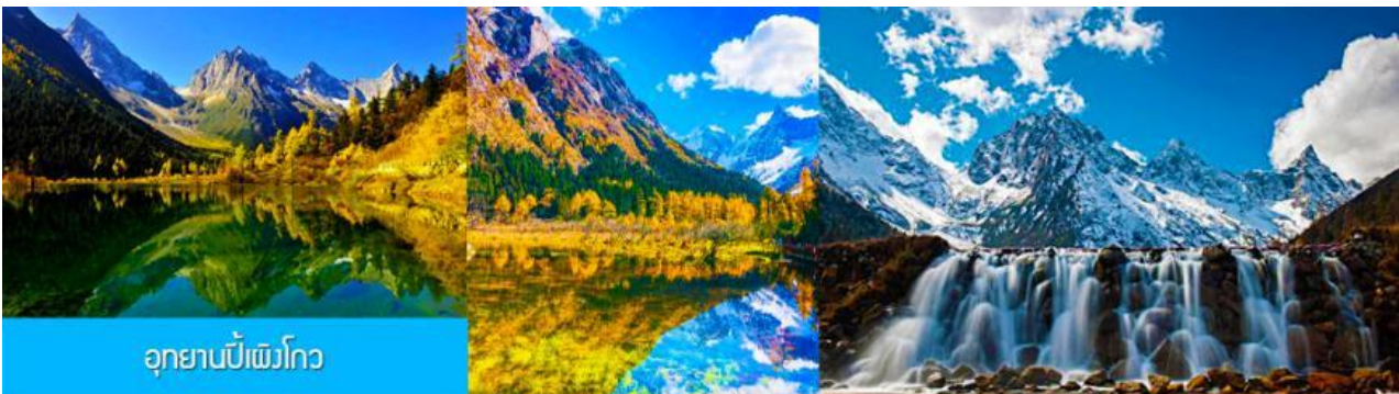
อุทยานเป่ย์ผิงโกว

หลังอาหารนำท่านเที่ยวชม อุทยานเป่ย์ผิงโกว 毕鹏沟景区 ที่เป็นแหล่งท่องเที่ยวธรรมชาติที่สวยงามได้รับฉายาว่าเป็นสวิตเซอร์แลนด์แดนใต้แห่งเมืองเสฉวน ตั้งอยู่เหนือระดับน้ำทะเลระหว่าง 2,015 เมตร – 3,500 เมตร ครอบคลุมพื้นที่ 614 ตารางกิโลเมตร ได้รับการขึ้นทะเบียนเป็นอุทยานท่องเที่ยวธรรมชาติระดับ 4A ของจีนในปี ค.ศ. 2013 และกลายเป็นอุทยานท่องเที่ยวยอดนิยมที่มีนักท่องเที่ยวเดินทางมาเยือนในปี 2023 ...นำท่านขึ้นรถบัสของอุทยานเพื่อเข้าไปยังเขตอุทยาน นำท่านขึ้นรถกอล์ฟแวะเที่ยวจุดชมวิวสำคัญต่าง ๆ ภายในเขตอุทยาน ที่ประกอบด้วย ธารน้ำแข็งและภูเขาหิมะ โอบล้อมอุทยาน ทะเลสาบที่มีสีน้ำเขียวมรกต ป่าไม้ ลำธารน้ำใสสะอาด น้ำตก ทุ่งหญ้าบนพื้นที่สูง ใบไม้เปลี่ยนสีและป่าไม้หลากสีในฤดูใบไม้ร่วง ทุ่งดอกไม้ในฤดูใบไม้ผลิ โดยมีจุด