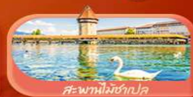
สะพานไม้ซังปก

Highlight เยือนหมู่บ้านแสนสวยเซอร์แมท เช็กอินศาลาไทยสุดงามที่โลซาน เที่ยวลูเซิร์น ชมสะพานไม้ซังเปลาและอนุสาวรีย์สิงโต ซาลี แอปลิน ชมประติมากรรม The Fork และปราสาทซิลลองริมทะเลสาบ เยือนมิลาน มหาวิหารดูโอโม เที่ยวเวนิส เมืองลอยน้ำสุดโรแมนติก อินกับรักอมตะที่บ้านจูเลียต และช้อปปิ้งจุใจที่ Serravalle Outlet