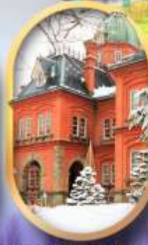
ศาลาว่าการฮอกไกโด