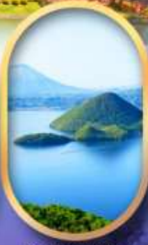
วิวทะเลสาบโทโย