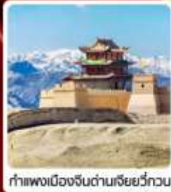
กำแพงเมืองจีนด่านเสี่ยววีกวน

• ไซโล่...เส้นทางสายไหม ชมสระบัววังพระจันทร์ ทะเลทรายหมิงซาซาน กำแพงเมืองจีนด่านสุดท้าย "เจียยวีกวน" มรดกโลกภูเขาสายรุ้งจางเย่