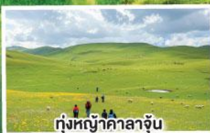
ทุ่งหญ้ายาคาลาจัน