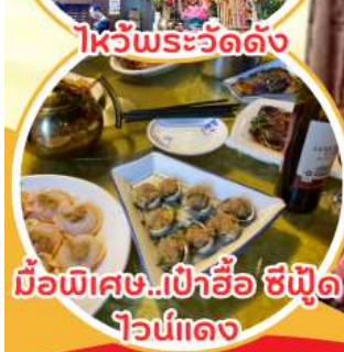
มือพิเศษ...เป่าอ้อ ซีฟู้ด ไวน์แดง