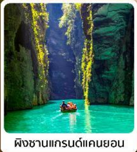
ผิงซานแกรนด์แคนยอน