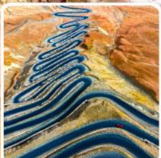
ถนนผานหลงกู่ต้าว