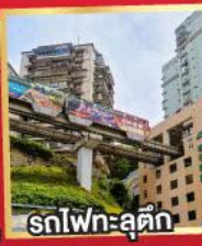
รถไฟฟ้า-ลุดัก