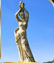
จูไห่ฟิชชอร์ทิวรา