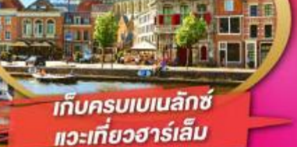
เก็บครบเบเนลักซ์ แวะเที่ยวฮาร์เลม