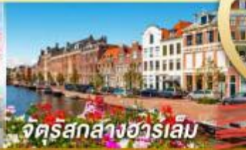
จัตุรัสกลางฮาร์เลม