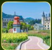
สวน Alice's Garden