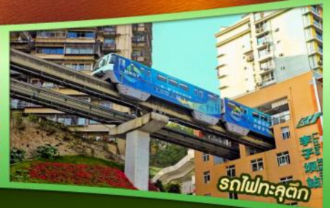
รถไฟฟ้าลัดคิว