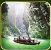
ล่องเรือแม่น้ำไตคินกูฮิว