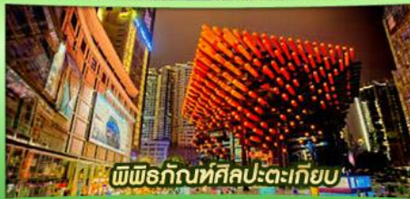
พิพิธภัณฑ์ศิลปะตะเกียบ