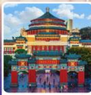
ศาลาประชาชนฉงชิ่ง