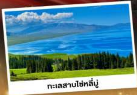
ทะเลสาบไซท์สีมู่

ชมวิวดอกดอกลังการแบบยุโรปผสมเอเชีย กุ้งหนุ่ยเขียวดำ ทะเลสาบสีเทอร์ควอยซ์