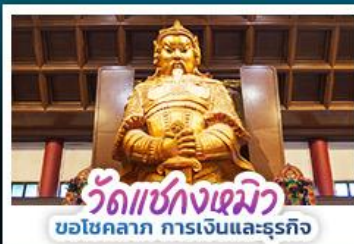
วัดเซ่งกวงเมิว ขอโชคลาภ การเงินและธุรกิจ