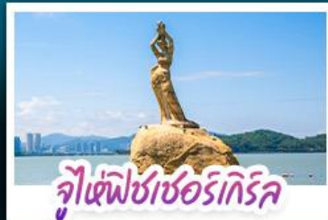
จุ๊เซ่ฟิซซอร์เทิร์ล