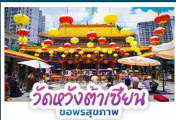
วัดแห่งต้าเซียน บอพรสุขภาพ