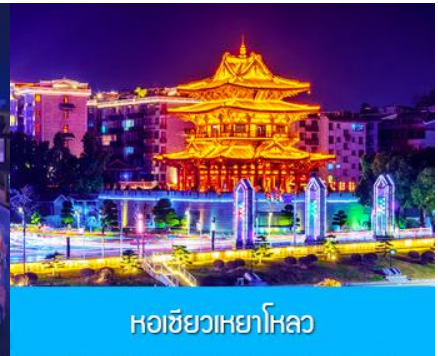
หอชิวเหยาไหล