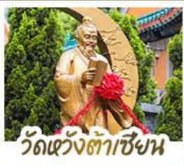
วัดเว้างเต้าเซ้าเน