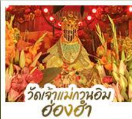
วัดเจ้าแม่กวนอิมอ้องฮ้า