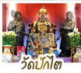
วัดป้กโก๊ต