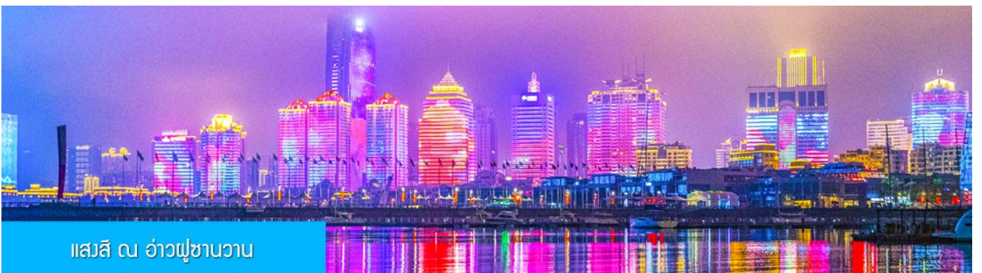
แอสสิ ณ อ่าวฟู่ซานวาว

ค่ำ รับประทานอาหารค่ำ ณ ภัตตาคาร *เมนูซีฟู้ด (3)