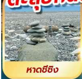
หาดซีซิง

เดินชมวิวเกาะเหอผิง ตะลุยกินตลาดมืชลินเหลาเหอ