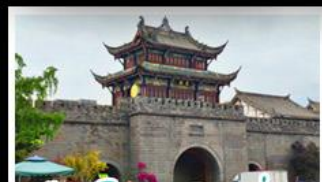
เมืองโบราณกวนเซี่ยน

ภูเขาสี่ดรุณี - อุทยานป่ฝิงโกว - สะพานหมานเฉียว - ร้านหนังสือจงซูเก้อ - เมืองโบราณกวนเสียน จตุรัสหย่างเทียนหวู่ - หมีแพนด้าเซอเฟี - ถนนโบราณชอยกวางชอยแคบ - ถนนคนเดินไท่กู่หลี่ ถนนคนเดินซุนซี - ถนนโบราณจินหลี่ - แพนด้ายักษ์ปิ่นตึก - น้ำพุไม้ไผ่ตึกSKP - วัดต้าอ้อ