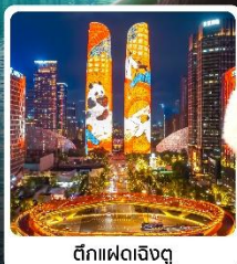
ตึกแฝดเจิงตู