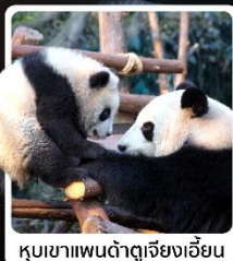
หุบเขาแพนด้าตู่เจียงเอี้ยน