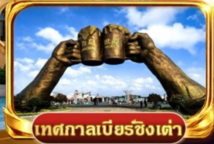
เทศกาลเบียร์ชิงเต่า