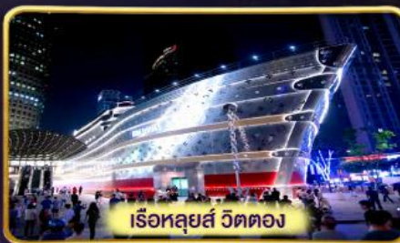
เรือหลุยส์ วัดตอง