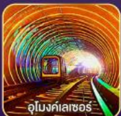
อุโมงค์เตาเซอร