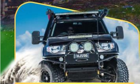
คันรถ 4WD สู้งางกลางเทือกเขาคอเคซัส