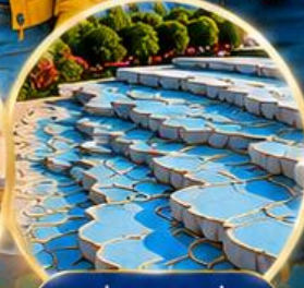
ปานุกคาล่ Pamukkale