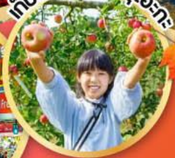
เก็บผลไม้เมืองชิซุโอะกะ