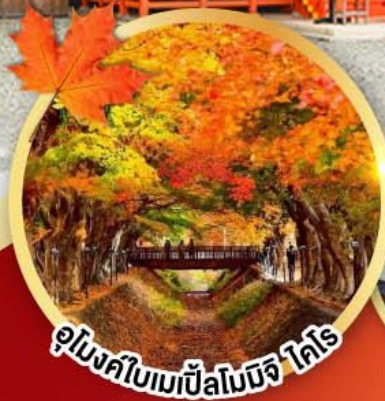
อุโมงค์ใบเมเปิ้ลโมจิ ไร่