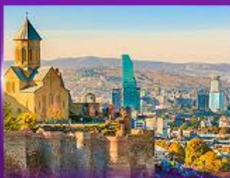
มั่งกระเช้าชมวิว ป้อมนาธิการ