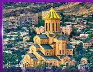
โบสถ์ศักดิ์สิทธิ์กริบตี