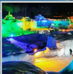
“SOUNKYO ICE FEST”