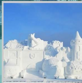
“ASAHIKAWA SNOW FEST”