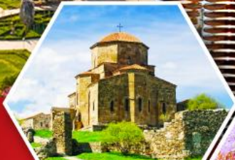
วิหารกออาร์