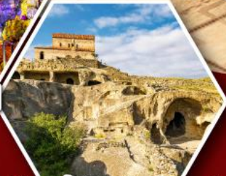
เมืองถ้ำอพลิสตซ์เคห์

พัก Rooms Hotel โรงแรมวิวหลักล้านของเทือกเขาคอเคซัส