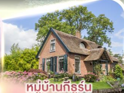
หมู่บ้านทีร์รุน