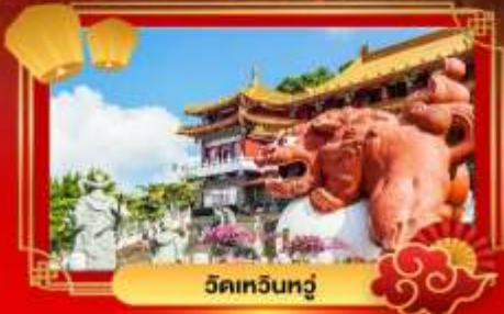
วัดเหวินทู่